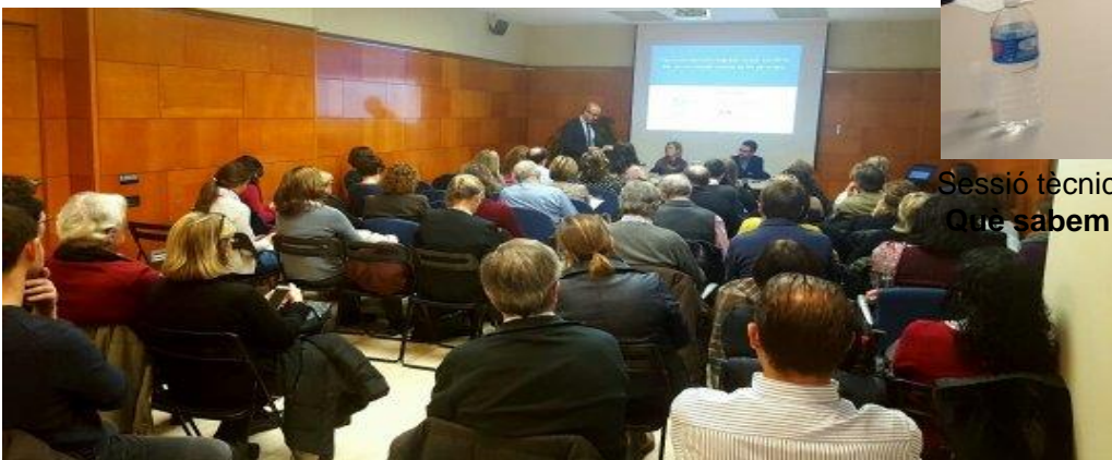
Sessió tècnica 21/01/16 Integració de l'atenció social i sanitària

Que sabem de l'activitat domiciliària dels professionals sanitaris