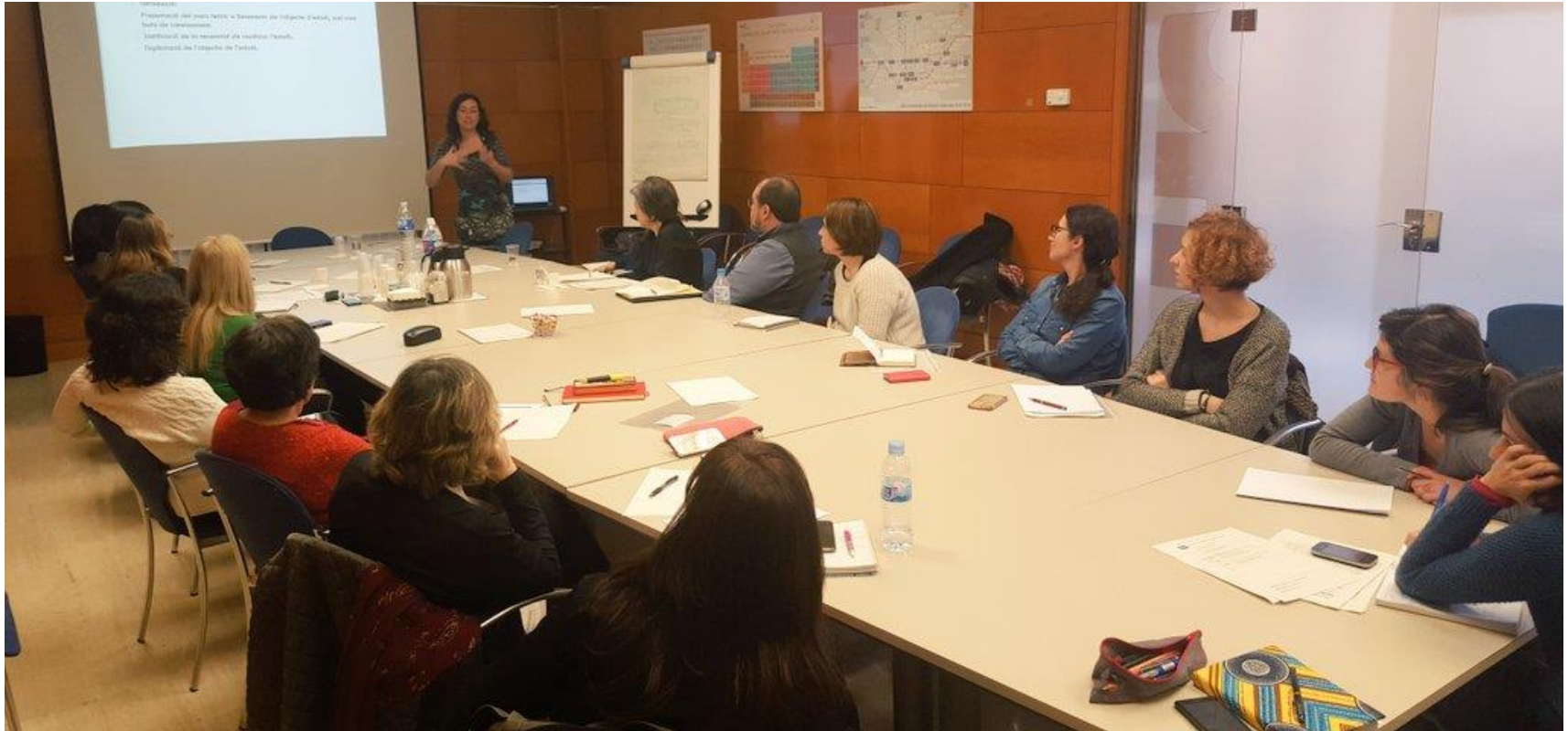
Reunió de la Comissió de Recerca Qualitativa. Març 2016.