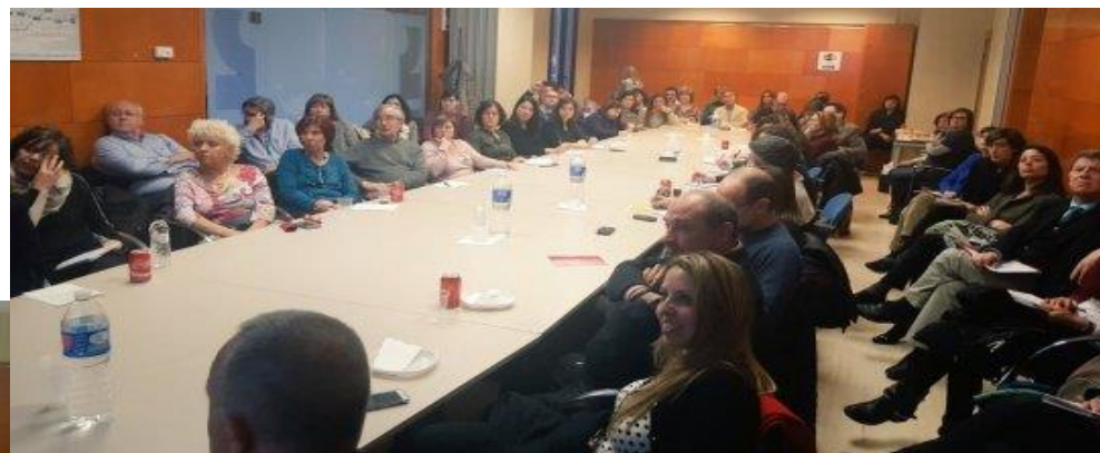
Sessió tècnica 17/03/16

Que sabem de l'activitat domiciliària dels professionals sanitaris