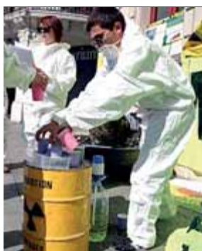
Activistes de la protesta d'ahir, en plena acció