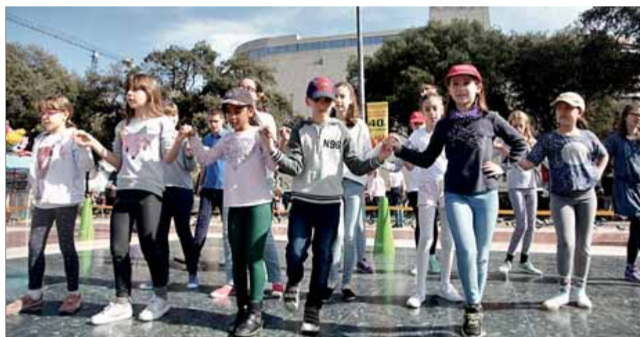
Un grup de nens que ahir van començar a aprendre a ballar sardanes ■ ELISABETH MAGRE