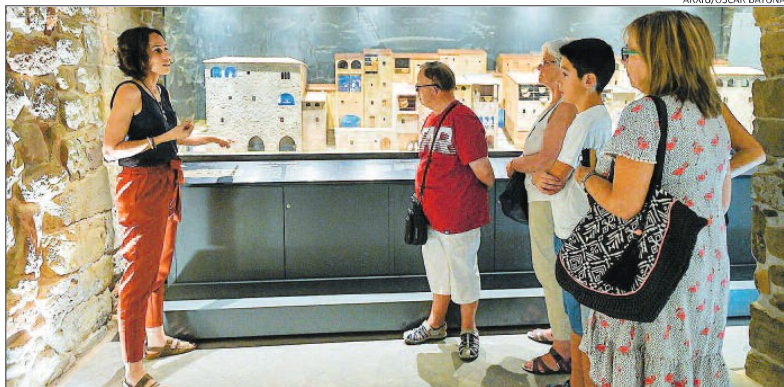
Imatge del carrer medieval del Balç de Manresa

▶ Les temàtiques seran el modernisme, sant Ignasi i la ciutat medieval