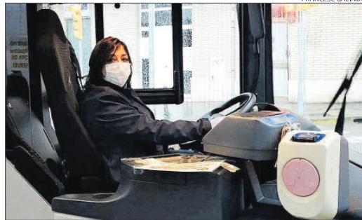
Una conductora del servei de bus urbà de Manresa